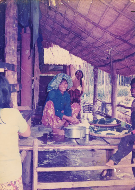
កង មី កំពុងធ្វើម្សៅនំបញ្ចុក នៅជំរំជែនកៀសខ្លួន ត្រង់ចំណុច ជប់ម្ហូរ នៃទឹកដីថៃ ក្នុងឆ្នាំ១៩៨៨។