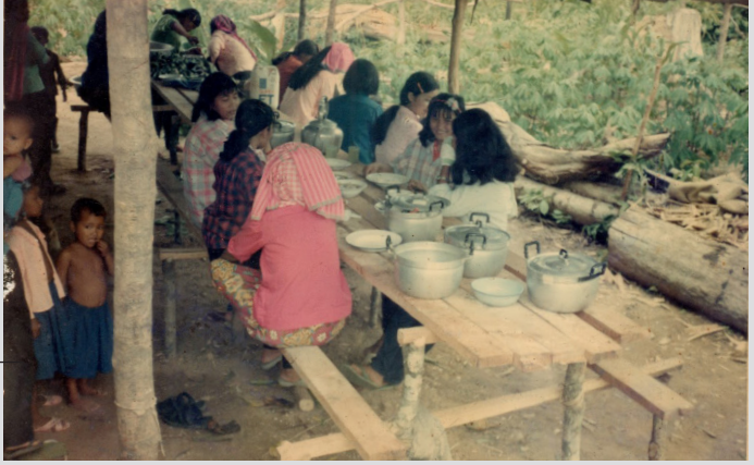
ប្រជាជននៅក្នុងភូមិ៨០០ចាស់ បច្ចុប្បន្នបានក្លាយជាភូមិ ទួលសាលា នៃស្រុកអន្លង់វែង។