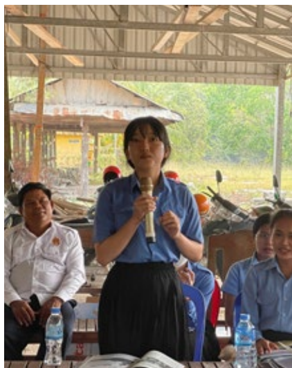
វេទិកាអប់រំសហគមន៍ស្តីពីការចងចាំប្រវត្តិសាស្ត្រខ្មែរក្រហម ដែលជាការរៀបចំដោយមជ្ឈមណ្ឌលឯកសារខេត្តតាកែវ ក្រោមកិច្ចសហការពីអាជ្ញាធរមូលដ្ឋានឃុំដូងខ្ពស់ និងគណៈកម្មការវត្តខ្នារកកោះ ត្រូវបានប្រារព្ធធ្វើនៅក្នុងបរិវេណវត្តខ្នារកកោះ ភូមិតាសៃ ឃុំដូងខ្ពស់ ស្រុកបូរីជលសារ ខេត្តតាកែវ នៅព្រឹកថ្ងៃទី១៨ ខែកុម្ភៈ ឆ្នាំ២០២៣។

មានសារសំខាន់ណាស់ក្នុងការថែរក្សាសន្តិភាពដែលមានស្រាប់។ លោកគាតាបានស្នើសុំឲ្យភ្លេងៗទាំងអស់យកចិត្តទុកដាក់ពីប្រវត្តិសាស្ត្រនេះ និងស្នើសុំឲ្យបន្តការពិភាក្សាពីប្រវត្តិសាស្ត្រនេះជាមួយជំងឺដូងខ្ពស់នៃសិស្សម្នាក់ៗ នៅតាមគេហដ្ឋានរៀនខ្លួនបន្ទាប់ពីបានចូលរួមនៅក្នុងវេទិកានេះរួច។ លោកគាតាបានបន្តថា អ្វីដែលជាការលើកឡើងរបស់ក្រុមការងារក៏ដូចជាការលើកឡើងរបស់អ្នករស់រានមានជីវិតពីរបបខ្មែរក្រហម គឺសុទ្ធសឹងតែជាការពិតជាក់ស្តែងដែលបានកើតឡើងនាសម័យខ្មែរក្រហម។