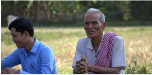
នៅថ្ងៃទី១១ ខែកុម្ភៈ ឆ្នាំ២០២៣ សិស្សានុសិស្សមកពី វិទ្យាល័យឈឺន លាន ហាន់ជ័យ ថ្នាក់វិទ្យាសាស្ត្រសង្គម ចំនួន៤០នាក់បានចូលរួមវេទិកាថ្នាក់រៀនស្តីពីប្រវត្តិសាស្ត្រ កម្ពុជាប្រជាធិបតេយ្យ (១៩៧៥-១៩៧៩) ដែល ប្រព្រឹត្តទៅ នៅ ភ្នំបរិវេណមជ្ឈមណ្ឌលឯកសារខេត្ត កំពង់ចាម

ជញ្ជូនអ្នកទៅ សយកទៅ សម្លាប់នៅ ការដ្ឋានទំនប់ គគរ និងដឹកសម្ភារមកទុកនៅមន្ទីរសន្តិសុខគគរ ថែក រំលែកហេតុការណ៍នៃការដឹកប្រជាជនខ្មែរ និងចាម ក្នុងមូលដ្ឋានយុគគគរ និងបទពិសោធន៍ជីវិតក្នុងរបប ខ្មែរក្រហមទៅកាន់សិស្សានុសិស្សចូលរួមទាំងអស់។