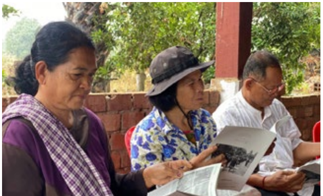
ប្រជាពលរដ្ឋក្នុងសហគមន៍អន្លង់វែងចូលរួមវេទិកា «លើកកំពស់សិទ្ធិស្ត្រី» រៀបចំដោយមជ្ឈមណ្ឌលសន្តិភាពអន្លង់វែង (បណ្ណសារមជ្ឈមណ្ឌលឯកសារកម្ពុជា)