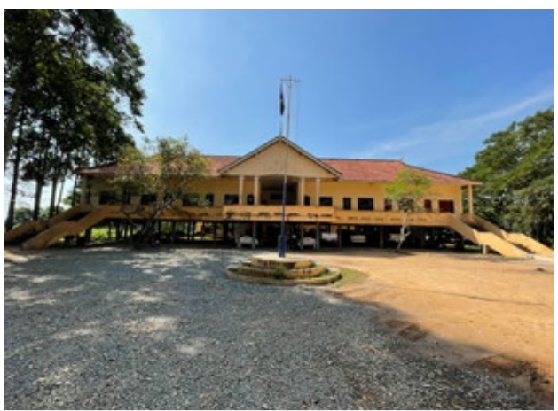
ដូច តាម៉ុក ។