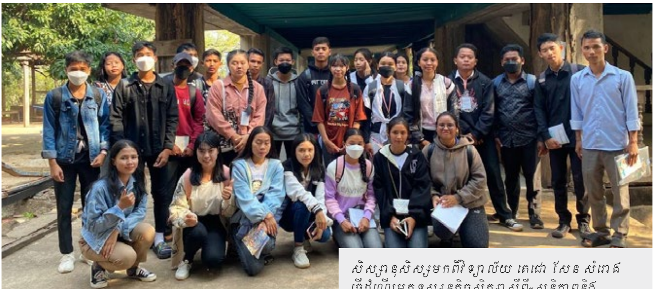
សិស្សានុសិស្សមកពីវិទ្យាល័យ តេជោ សែន សំរោង ធ្វើដំណើរមកទស្សនកិច្ចសិក្សាស្តីពី «សន្តិភាពនិងសិទ្ធិមនុស្ស» នៅមជ្ឈមណ្ឌលសន្តិភាពអន្លង់វែង និងតំបន់ប្រវត្តិសាស្ត្រអន្លង់វែង កាលពីថ្ងៃទី១២ ខែកុម្ភៈ ឆ្នាំ២០២៣។

នៅថ្ងៃទី១២ ខែកុម្ភៈ ឆ្នាំ២០២៣ មជ្ឈមណ្ឌលសន្តិភាពអន្លង់វែង នៃមជ្ឈមណ្ឌលឯកសារកម្ពុជា បានរៀបចំទទួលស្វាគមន៍សិស្សានុសិស្សមកពីវិទ្យាល័យ តេជោ សែន សំរោង ចំនួន ២៣នាក់ ក្នុងនោះមានសិស្សស្រីចំនួន១៣នាក់ និងសិស្សប្រុសចំនួន១០នាក់។ ទស្សនកិច្ចសិក្សានេះគឺដើម្បីឈ្វេងយល់អំពី «ប្រវត្តិសាស្ត្រកម្ពុជា ប្រជាធិបតេយ្យ (១៩៧៥-១៩៧៩) និង «ប្រវត្តិសាស្ត្រសហគមន៍អន្លង់វែង»។