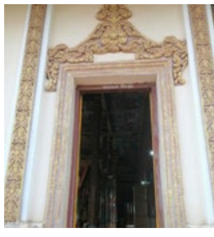
វត្តរោងដំរី ស្ថិតនៅក្នុង សង្កាត់កំពង់លាវ ក្រុង ព្រៃវែង ខេត្តព្រៃវែង