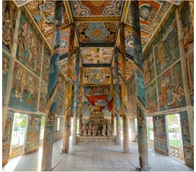
វេទិកាអប់រំ សហគមន៍ស្តីពីការចងចាំប្រវត្តិសាស្ត្រខ្មែរក្រហម ដែលជាការរៀបចំដោយមជ្ឈមណ្ឌលឯកសារខេត្តតាកែវ ក្រោមកិច្ចសហការពីអាជ្ញាធរមូលដ្ឋានឃុំដូងខ្ពស់ និងគណៈកម្មការវត្តខ្នារកកោះ ត្រូវបានប្រារព្ធធ្វើនៅ ភ្នំបរិវេណវត្តខ្នារកកោះ ភូមិតាសៃ ឃុំដូងខ្ពស់ ស្រុកបូរីជលសារ ខេត្តតាកែវ នៅព្រឹកថ្ងៃទី១៧ ខែកុម្ភៈ ឆ្នាំ២០២៣

ក្រហមភ្នំអំឡុងដើមទសវត្សរ៍ឆ្នាំ១៩៧០ ហើយព្រះវិហារចាស់ទ្រុឌទ្រោមត្រូវបានប្រើប្រាស់ជាកន្លែងដាក់អំបិលភ្នំរបបខ្មែរក្រហម។ ខាងក្រោមនេះ ជាប្រវត្តិត្រួសៗពីវត្តខ្នារកកោះ ៖