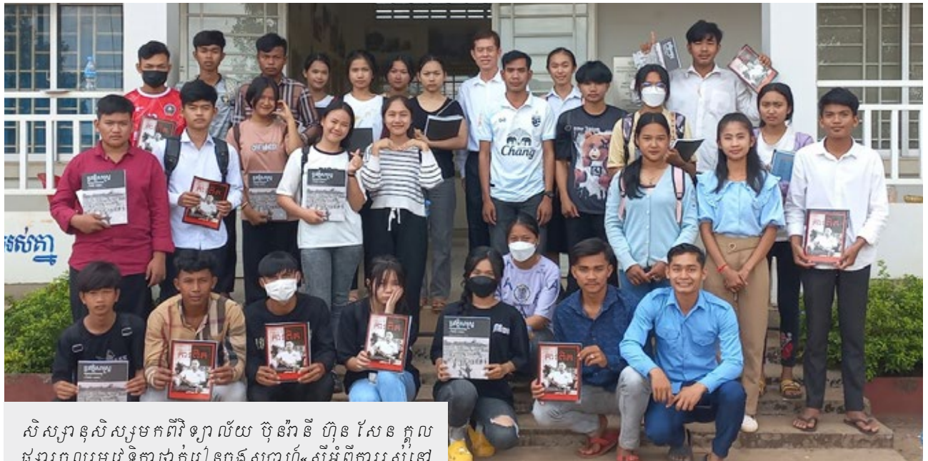
សិស្សានុសិស្សមកពីវិទ្យាល័យ ប៉ូនរ៉ានី ហ៊ុន សែន ក្នុង ជួរមុខ ចូលរួមវេទិកាថ្នាក់រៀនចូលសប្តាហ៍ «ស្តីអំពីការរស់នៅ ប្រចាំថ្ងៃរបស់ជនជាតិដើមភាគតិចស្បៀងនៅ ស្រុកមេមត់ ភ្នំពេញ» កាលពីថ្ងៃទី១៧ ខែកុម្ភៈ ឆ្នាំ២០២៣