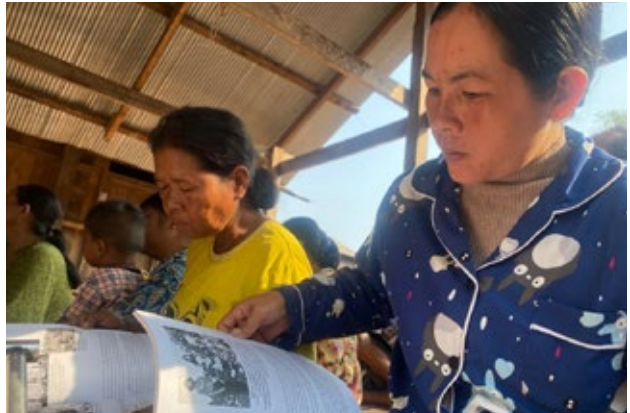
មជ្ឈមណ្ឌលសន្តិភាពអន្តរវិស័យបានរៀបចំវេទិកាសហគមន៍ មួយនៅក្នុងភូមិទួលប្រាសាទនៃស្រុកអន្តរវិស័យ ដោយផ្តោត ទៅលើ «ប្រវត្តិសាស្ត្រកម្ពុជាប្រជាធិបតេយ្យ (១៩៧៥- ១៩៧៧)» និងដំណើរការនៃការកាត់ទោសមេដឹកនាំខ្មែរ ក្រហមនៅក្នុងអង្គជំនុំជម្រះវិសាមញ្ញតុលាការកម្ពុជា» នៅ ថ្ងៃទី១៣ ខែកុម្ភៈ ឆ្នាំ២០២៣។