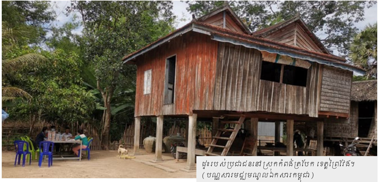
ផ្ទះរបស់ប្រជាជននៅស្រុកកំពង់ត្របែក ខេត្តព្រៃវែង

ក៏វាយចូលមកដល់ ពេលនោះខ្សែក្រហមសម្លាប់ខ្ញុំ និងប្រជាជនផ្សេងទៀតមិនទាន់ក៏កៀរពួកខ្ញុំទៅដល់ ស្រុកព្រះស្តេច កងទ័ពវៀតណាមតាមទាន់ក៏ប្រាប់ ឲ្យខ្ញុំនិងប្រជាជនផ្សេងទៀតត្រឡប់ក្រោយមកភូមិ កំណើតវិញ។ ពេលខ្ញុំមកដល់ភូមិវិញប្រជាជនមួយ ចំនួននាំគ្នាដេញកាប់សម្លាប់ខ្ញុំហៀបតែស្លាប់ដោយ ចោទថាខ្ញុំជាបក្សពួក ប៉ុល ពត ប៉ុន្តែសំណាងល្អខ្ញុំ ត្រូវកងទ័ពវៀតណាមចាប់ខ្លួនយកទៅសួរចម្លើយ នៅព្រៃពន្លាចក្រ និងបញ្ជូនខ្ញុំបន្តរហូតទៅដល់តា ជ័យ ខេត្តស្វាយរៀង។ កងទ័ពវៀតណាមចាត់ឲ្យ ខ្ញុំ និងអ្នកទោសរាប់រយនាក់ទៀត ធ្វើការងារនៅ ស្វាយរៀងអស់រយៈពេល ៣ខែ ២៥ថ្ងៃ ខ្ញុំក៏បាន លួចរត់ចេញមកកាន់ភូមិចាមស្រុក ខាងប្រពន្ធបាន បីថ្ងៃ។ ដោយសារស្ថានភាពមិនស្រួលខ្ញុំបន្តរត់ទៅ ខេត្តកំពង់ចាមមួយរយៈទៀតទើបត្រឡប់មករស់នៅ ជួបជុំប្រពន្ធកូនវិញ។ នៅក្នុងរបបខ្សែក្រហម ខ្ញុំបាត់ បង់បងប្អូនបង្កើតដែលជាយោធាខ្សែក្រហមប្រធាន «ខ» និងយោធាកងពលលេខ ៤ អស់ជាច្រើននាក់ ដោយសារខ្សែក្រហមសម្លាប់ខ្ញុំស្អប់របបខ្សែក្រហម ដែលសម្លាប់ជីវិតប្រជាជនស្នូតត្រង់អស់រាប់លាន នាក់និងមិនចង់ឲ្យរបបខ្សែក្រហមកើតឡើងវិញម្តង ទៀតនោះទេ។