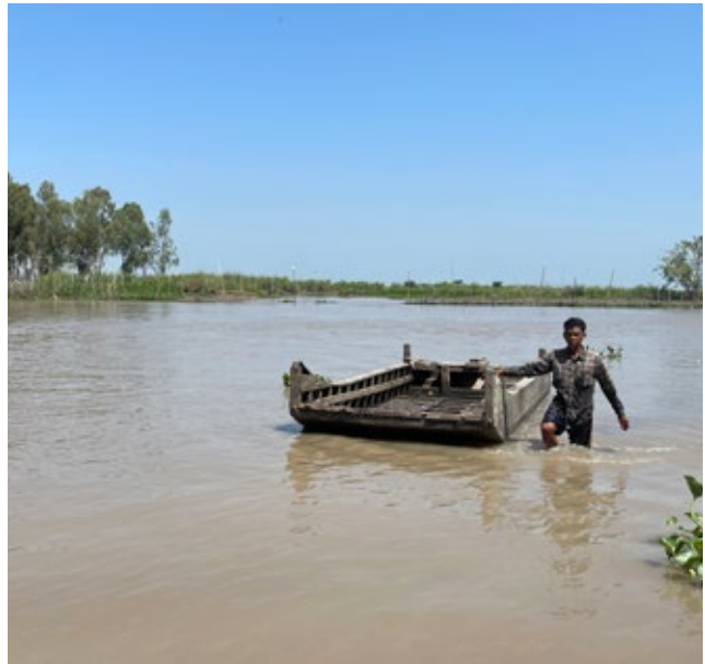
ទំនប់នគាម៉ុក ( បណ្ណសារមជ្ឈមណ្ឌលឯកសារកម្ពុជា )