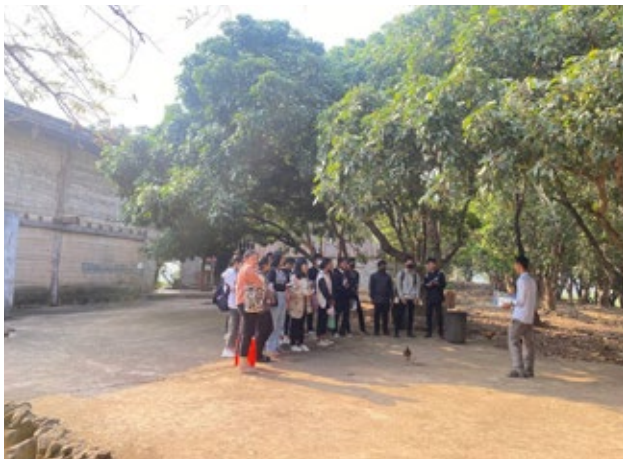
សិស្សានុសិស្សមកពីវិទ្យាល័យ គេដោ សែន សំរោង ធ្វើដំណើរមកទស្សនកិច្ចសិក្សាស្តីពី «សន្តិភាពនិងសិទ្ធិមនុស្ស» នៅមជ្ឈមណ្ឌលសន្តិភាពអន្តរវែង និងតំបន់ប្រវត្តិសាស្ត្រអន្តរវែង កាលពីថ្ងៃទី១២ ខែកុម្ភៈ ឆ្នាំ២០២៣។