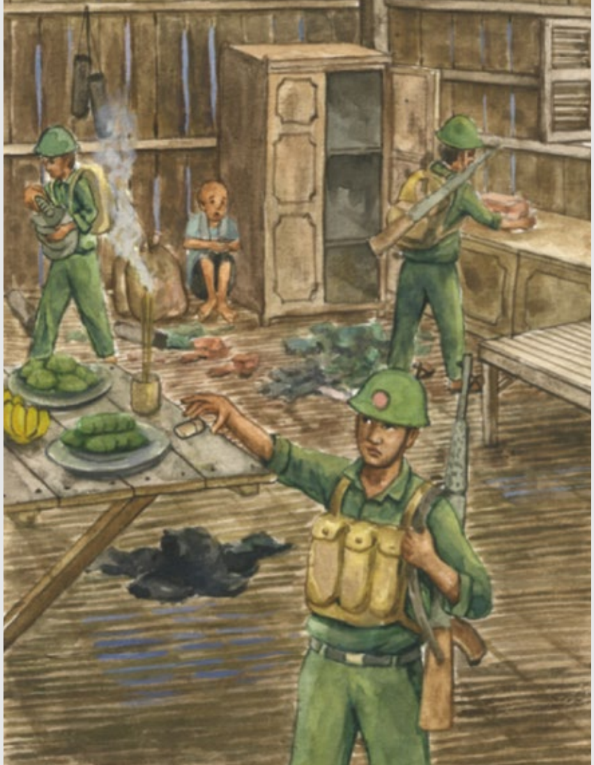
ទិដ្ឋភាពតំណាល៖ កងទ័ពវៀតណាមបានចូលមកផ្ទះ ខ្ញុំចំពេលចូលឆ្នាំខ្មែរ និងដៃឈោងយកដៃកកេះ។ (ឡង វង្ស សមិទ្ធិ/សៀវភៅ ទូលពិយាដ)

ក៏សួរទៅយាយថា “ចុះ តា បង ជា បងណាត និងប្អូនវា ទៅណាអស់ ហើយ?” គាត់តបមកថា “ការបស់ ចៅ ឯងទៅលេងអ៊ុំទូច ឯងនៅ ឯភូមិ ព្រៃក្រ ឡាញ់តូចតាំងពីព្រលឹមម៉្លោះ ចំណែកចិត្ត ចៅណាត និងចៅវា ទៅលេងនៅ ឯខាងកើតភូមិ។”