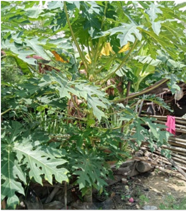
មាស ជុំ ដាំដំណាំបន្ទាប់បន្សំនៅផ្ទះដើម្បីផ្គត់ផ្គង់ការហូបចុកនៅក្នុងគ្រួសារ

ដួលរលំភ្លាមៗ ខ្ញុំនៅជួបការលំបាកនៅឡើយ ព្រោះមិនទាន់មានអាហារហូបគ្រប់គ្រាន់ រយៈពេលពីរឆ្នាំក្រោយមក ទើបជីវភាពគ្រួសាររបស់ខ្ញុំបានល្អប្រសើរ ហូតមកដល់ពេលបច្ចុប្បន្ន។