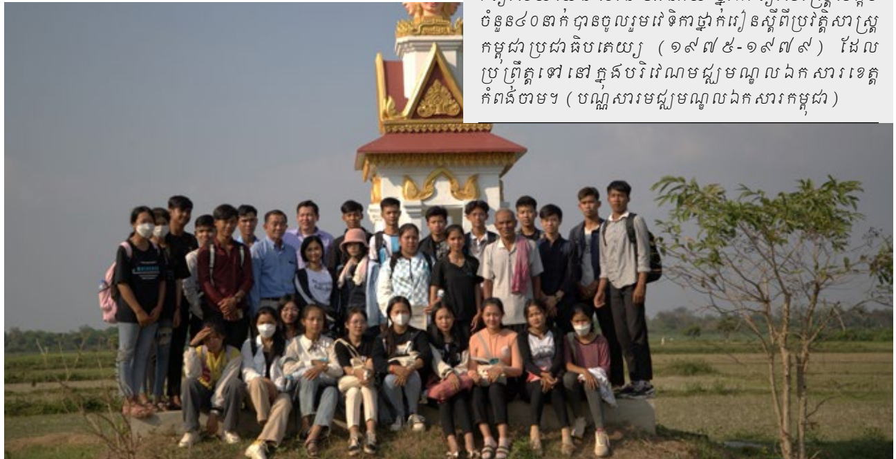
នៅថ្ងៃទី១១ ខែកុម្ភៈ ឆ្នាំ២០២៣ សិស្សានុសិស្សមកពីវិទ្យាល័យឈ័ន លាន ហាន់ដើម ថ្នាក់វិទ្យាសាស្ត្រសង្គមចំនួន៤០នាក់ បានចូលរួមវេទិកាថ្នាក់រៀនស្តីពីប្រវត្តិសាស្ត្រកម្ពុជាប្រជាធិបតេយ្យ (១៩៧៥-១៩៧៩) ដែលប្រព្រឹត្តទៅនៅក្នុងបរិវេណមជ្ឈមណ្ឌលឯកសារខេត្តកំពង់ចាម (បណ្ណសារមជ្ឈមណ្ឌលឯកសារកម្ពុជា)