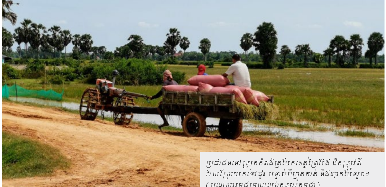
ប្រជាជននៅស្រុកកំពង់ត្របែកខេត្តព្រៃវែង ដឹកស្រូវពីវាលស្រែយកទៅដុះ បន្ទាប់ពីច្រូតកាត់ និងបោកបែនរួច។