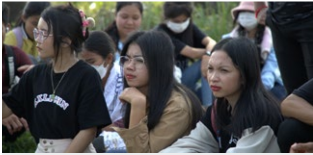
នៅថ្ងៃទី១១ ខែកុម្ភៈ ឆ្នាំ២០២៣ សិស្សានុសិស្សមកពី វិទ្យាល័យឈឺន លាន ហាន់ជ័យ ថ្នាក់វិទ្យាសាស្ត្រសង្គម ចំនួន៤០នាក់បានចូលរួមវេទិកាថ្នាក់រៀនស្តីពីប្រវត្តិសាស្ត្រ កម្ពុជាប្រជាធិបតេយ្យ (១៩៧៥-១៩៧៩) ដែល ប្រព្រឹត្តទៅ នៅ ភ្នំបរិវេណមជ្ឈមណ្ឌលឯកសារខេត្ត កំពង់ចាម