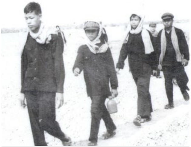
កម្មាភិបាលខ្មែរក្រហមដើរនៅវាលស្រែ។

កំណត់ចំណាំ៖ អត្ថបទនេះ ដកស្រង់ចេញពី ចម្លើយសារភាពឯកសារ៧០០៦២៧។ រាល់ចម្លើយ សារភាពរបស់អ្នកទោសទាំងអស់នៅមន្ទីរសន្តិ សុខស-២១ សុទ្ធតែឆ្លងកាត់ការបង្ខិតបង្ខំនិងធ្វើ ទារុណកម្មយ៉ាងធ្ងន់ធ្ងរពីកងសួរចម្លើយរបស់ខ្មែរ ក្រហម ដូច្នោះយើងមិនអាចសន្និដ្ឋានបានថាចម្លើយ សារភាពរបស់ គឺម ភិកតុន ពិតឬយ៉ាងណានោះទេ?