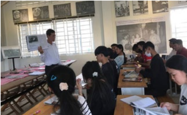
សិស្សានុសិស្សមកពីវិទ្យាល័យ ប៊ុនរ៉ានី ហ៊ុន សែន ក្នុង ជម្រកចូលរួមវេទិកាថ្នាក់រៀនចុងសប្តាហ៍ស្តីពីការរស់នៅ ប្រចាំថ្ងៃរបស់ជនជាតិដើមភាគតិចស្ទៀងនៅស្រុកមេមត់ ក្នុងរបបខ្មែរក្រហម កាលពីថ្ងៃទី១៧ ខែកុម្ភៈ ឆ្នាំ២០២៣

ពីវិទ្យាល័យប៊ុនរ៉ានី ហ៊ុន សែន ក្នុងជម្រក នៅឃុំ ទន្លេស្រុកមេមត់ ថ្ងៃនេះ ខ្ញុំ ពិតជា រំភើបចំពោះ ការ មកទស្សនកិច្ចនៅ ក្នុងមជ្ឈមណ្ឌលឯកសារកោះ ថ្ម ព្រោះ វាជា លើក ទីមួយ ដែល ខ្ញុំ មក ចូលរួម ។ ពេល ចូលមក ដល់ ភ្នាក់ងារ ខ្ញុំ ចាប់អារម្មណ៍ យ៉ាង ខ្លាំង ទៅ លើ ផ្ទាំង កំនូរ និង ផែនទី ដែល រៀបចំ នៅ មជ្ឈមណ្ឌល ឯកសារ កោះ ថ្ម គឺ បង្ហាញ ពី អ្នក រស់ រាន មា ន ជីវិត ដែល ពួក គេ គ្រប់ គ្រាន់ គ្រាន់ ការ លំបាក វេទនា ពី របប ប្រល័យ ពូជ សាសន៍ នេះ ។ មុន ពេល ខ្ញុំ មក ទស្សនកិច្ច នៅ ក្នុង ថ្ងៃ នេះ ខ្ញុំ ត្រាន់ តែ ដឹង ថា ខ្មែរ ក្រហម ធ្វើ ឲ្យ មនុស្ស ស្លាប់ ប៉ុន្តែ មិន បាន ដឹង ថា ខ្មែរ ក្រហម បាន ជម្លៀស ប្រជាជន ចេញ ពី ស្រុក កំណើត ហើយ ឲ្យ ប្រជាជន ធ្វើ ការ ហួស កម្លាំង ពលកម្ម ដោយ ធ្វើ