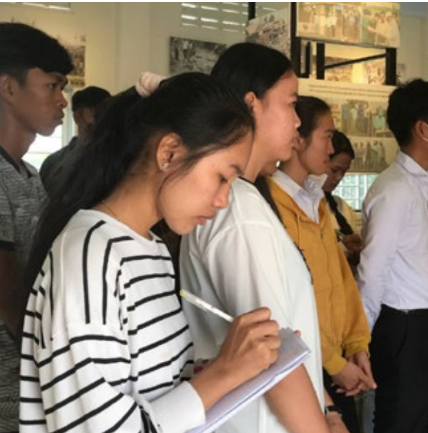
សិស្សានុសិស្សមកពីវិទ្យាល័យ ប៉ុន្តែវ៉ានី ហ៊ុន សែន ក្នុងដង្ការចូលរួមវេទិកាថ្នាក់រៀនចុងសប្តាហ៍ «ស្តីអំពីការរស់នៅប្រចាំថ្ងៃរបស់ជនជាតិដើមភាគតិចស្ងៀមនៅស្រុកមេមត់ ភ្នំស្រុកបង្កប់ខ្មែរក្រហម» កាលពីថ្ងៃទី១៧ ខែកុម្ភៈ ឆ្នាំ២០២៣។

៦) បន្ទុកកម្ម និងការសម្លាប់បង្កាត់ : ជនជាតិដើមភាគតិចស្ងៀម ត្រូវបានចាប់យកទៅដាក់កុក ធ្វើទារុណកម្ម និងសម្លាប់ដូចប្រជាជនកម្ពុជាដទៃទៀត