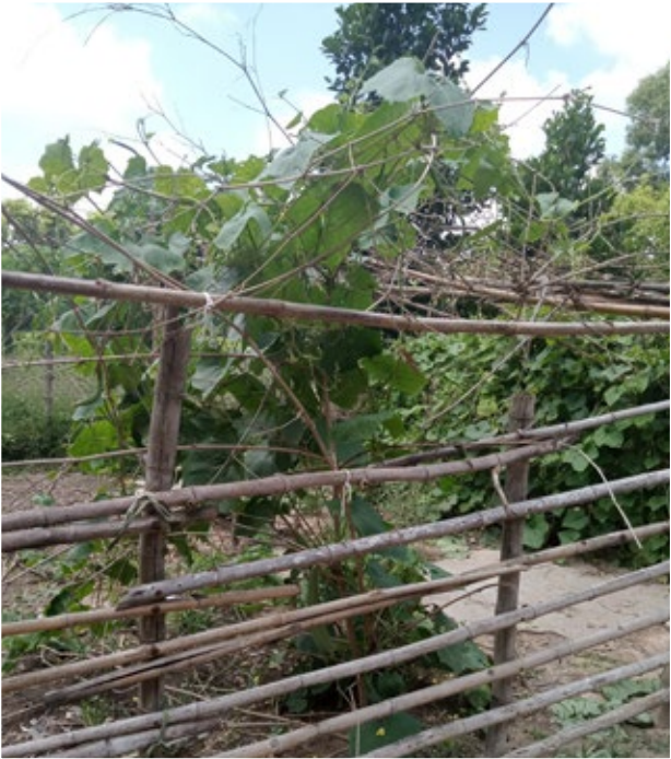
វានិងសិនី ដាំដំណាំបន្ទាប់បន្សំនៅដូន ដើម្បីផ្គត់ផ្គង់ការហូបចុកនៅក្នុងគ្រួសារ។ (បណ្ណសារមជ្ឈមណ្ឌលឯកសារកម្ពុជា)

ព្រៃកុយ ស្ថិតនៅ ភូមិយុំជ្រៃ ស្រុកកំពង់ត្រៃបែក ខេត្តព្រៃវែង បម្រុងនឹងសម្លាប់ចោល ប៉ុន្តែដោយសារកងទ័ពរណស័យសាមគ្គីសង្គ្រោះជាតិកម្ពុជា និងកងទ័ពស្ម័គ្រចិត្តវៀតណាមវាយចូលដល់ស្វាយរៀង ទើបធ្វើឲ្យខ្មែរក្រហមមកពីភូមិភាគនិរតីជ្រួលច្របល់ ហើយកៀរខ្ញុំ និងអ្នកភូមិទាំងអស់ទៅទិសខាងលិចវិញ។ ពេលខ្ញុំមកដល់ស្រុកព្រះស្តេច ខេត្តព្រៃវែង កងទ័ពរណស័យសាមគ្គីសង្គ្រោះជាតិកម្ពុជា និងកងទ័ពស្ម័គ្រចិត្តវៀតណាមបានតាមទាន់ និងប្រាប់ខ្ញុំឲ្យត្រឡប់មកស្រុកកំណើតវិញ។