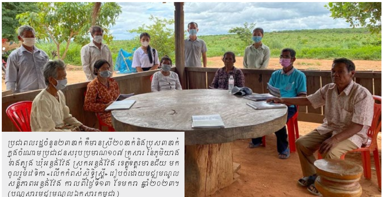
ប្រជាពលរដ្ឋចំនួន២៣នាក់ គឺមានស្រី២០នាក់និងប្រុស៣នាក់ ក្នុងចំណោមប្រជាជនសរុបប្រមាណ១០៧ គ្រួសារ នៃភូមិយាន ខាងត្បូង ឃុំអន្លង់វែង ស្រុកអន្លង់វែង ខេត្តត្បូងឃ្មុំមានជ័យ មក ចូលរួមវេទិកា «លើកកំពស់សិទ្ធិស្ត្រី» រៀបចំដោយមជ្ឈមណ្ឌល សន្តិភាពអន្លង់វែង កាលពីថ្ងៃទី១៣ ខែមករា ឆ្នាំ២០២៣។

បារាំង បានបង្កើតប៉ូស្តិប៊ុនលិសព្រំដែនតូចមួយ នៅតាមបណ្តាយព្រំដែននេះដើម្បីការពារ ការវាយ ប្រហារពីក្រុមចោរព្រៃ ដែលបង្កជាបញ្ហាខ្លាំងនៅ ក្នុងតំបន់នោះ។ នៅឆ្នាំក្រោយៗមកទៀត ភាពដាច់ ស្រយាលរបស់អន្លង់វែងបានធ្វើឲ្យតំបន់នេះក្លាយ ទៅជាកោលដៅឆាយស្រួលបំផុតសម្រាប់ការ ជ្រៀតចូល និងការកាន់កាប់របស់ខ្មែរក្រហម។ ខ្មែរក្រហមបានគ្រប់គ្រងអន្លង់វែងនៅក្នុងឆ្នាំ១៩៧០