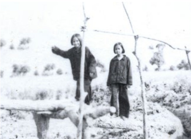
កងកុមារនៅក្នុងរបបខ្មែរក្រហម