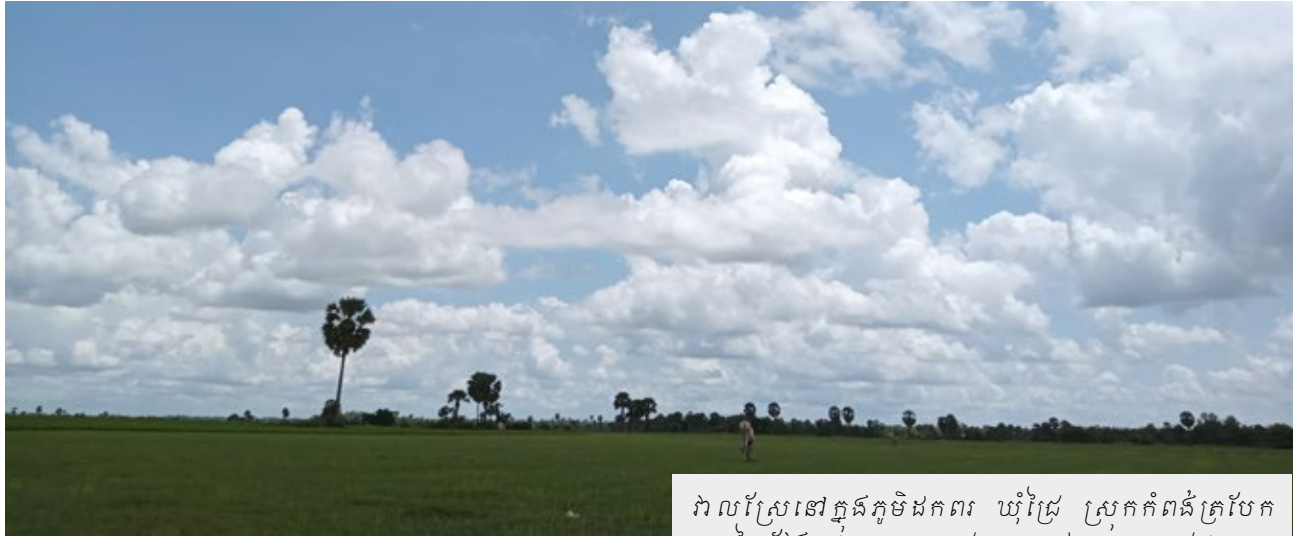
វាលស្រែនៅភ្នំភូមិដកពរ ឃុំជ្រៃ ស្រុកកំពង់ត្របែក ខេត្តព្រៃវែង

នៅដើមឆ្នាំ១៩៧៧ ពេលកងទ័ពរណសិរ្ស សាមគ្គីសង្រ្គោះជាតិកម្ពុជា និងកងទ័ពវៀតណាម វាយចូលមក ខ្ញុំនិងអ្នកភូមិត្រូវបានខ្មែរក្រហមកៀរ ទៅស្រុកព្រះស្តេច ទើបយើងនាំគ្នាត្រឡប់មកភូមិ កំណើតវិញ។ ខ្ញុំនិងប្រជាជនចាប់ផ្តើមហូបបាយ ឯកជននៅតាមដុះរៀងៗខ្លួនវិញ។ ប៉ុន្តែនៅពេលរបប ខ្មែរក្រហមដួលរលំទៅថ្មី ខ្ញុំនៅជួបការលំបាកខ្លះ ទាក់ទងនឹងការហូបចុក។ ដូច្នោះប្តីរបស់ខ្ញុំបាន ទៅទិញនំប៉័ងនៅបារីត ភ្នំខេត្តស្វាយរៀង យកទៅ លក់នៅភ្នំពេញ។ កាលនោះពុំមានម៉ូតូ ឬ ឡានឈ្នួល ឡើយ ដូច្នោះប្តីរបស់ខ្ញុំត្រូវដាក់កងដឹកនំប៉័ងលក់។ ខ្ញុំនិងប្តីខិតខំស៊ូព្យាយាមរកស៊ីរហូតមានជីវភាព សមរម្យរហូតមកដល់សព្វថ្ងៃ។