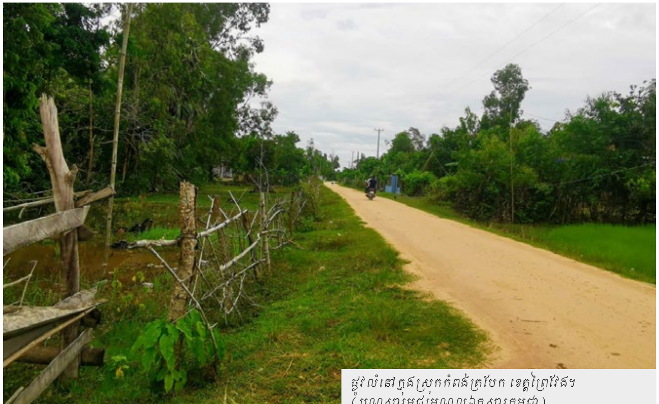
ផ្លូវលំនៅក្នុងស្រុកកំពង់ត្របែក ខេត្តព្រៃវែង

នៅឆ្នាំ១៩៧៧ ប្រជាជនភាគច្រើនត្រូវខ្មែរក្រហមជម្លៀសទៅកាកខាងលិចនៃប្រទេស។ ខ្ញុំក៏បានត្រឡប់មករស់នៅភូមិកំណើតវិញ។ ក្រោយពេលដួលរលំរបបខ្មែរក្រហម ខ្ញុំបានឃើញក្បាលខ្មោចដែលត្រូវខ្មែរក្រហមសម្លាប់នៅទួលតាអនក្នុងមួយអន្លឹង៨០នាក់។