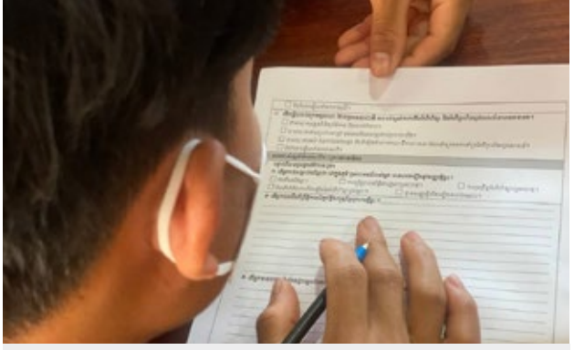
សិស្សានុសិស្សចំនួន២៦នាក់ ក្នុងនោះមានសិស្សប្រុស១២នាក់ និងស្រី១៤នាក់ នៃវិទ្យាល័យអន្លង់វែង បច្ចុប្បន្ននៅក្នុងវេទិកាថ្នាក់រៀនស្តីពី «ប្រវត្តិសាស្ត្រកម្ពុជាប្រជាធិបតេយ្យ (១៩៧៥-១៩៧៧)» នៅការិយាល័យមជ្ឈមណ្ឌលសន្តិភាពអន្លង់វែង កាលពីថ្ងៃទី១០ ខែកុម្ភៈ ឆ្នាំ២០២៣។