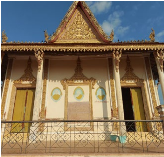
វត្តរោងដំរី ស្ថិតនៅក្នុងសង្កាត់កំពង់លាវ ក្រុងព្រៃវែង ខេត្តព្រៃវែង