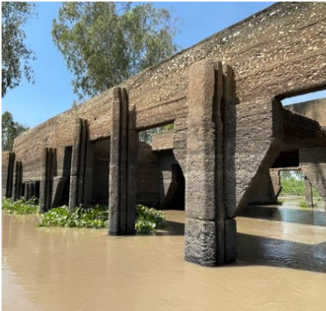
ស្ពាននគាម៉ុក ( បណ្ណសារមជ្ឈមណ្ឌលឯកសារកម្ពុជា )