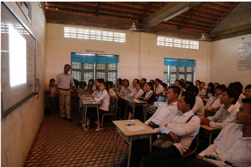
សិស្សានុសិស្សថ្នាក់ទី១២ មកពីវិទ្យាល័យ ចាក់អង្រែ កំពុងស្តាប់ការធ្វើបទបង្ហាញពីប្រវត្តិសាស្ត្រកម្ពុជាប្រជាធិបតេយ្យ ដោយសង្ខេប។ ថតថ្ងៃទី១៩ ខែមិថុនា ឆ្នាំ២០១៦

កម្មវិធីអប់រំពីអំពើប្រល័យពូជសាសន៍នៅកម្ពុជាមាន ១) កម្មវិធីសិក្សាពីអំពើប្រល័យពូជសាសន៍ និង ២) ចែកសៀវភៅ “ប្រវត្តិសាសន៍កម្ពុជាប្រជាធិបតេយ្យ (១៩៧៥-១៩៧៩)” បោះពុម្ពដោយមជ្ឈមណ្ឌលឯកសារកម្ពុជា សហការជាមួយក្រសួងអប់រំ យុវជន និងកីឡា នៅវិទ្យាល័យទាំងអស់ក្នុងប្រទេសកម្ពុជា។ ដើម្បីកសាងមូលដ្ឋានគ្រឹះសម្រាប់ការអប់រំពីអំពើប្រល័យពូជសាសន៍ វេទិកាថ្នាក់រៀនលើកដំបូងត្រូវបានធ្វើឡើងនៅវិទ្យាល័យចំនួន១៥ក្នុងរាជធានីភ្នំពេញ ដើម្បីផ្តល់ដល់សិស្សានុសិស្សនូវចំណេះដឹងជាបឋមអំពីប្រវត្តិសាស្ត្រកម្ពុជាប្រជាធិបតេយ្យ។ គោលបំណងនៃការធ្វើវេទិកានេះ គឺជួយបំពេញបន្ថែមដល់សិស្សានុសិស្ស នូវចំណេះដឹងពីប្រវត្តិសាស្ត្រកម្ពុជាប្រជាធិបតេយ្យ និងប្រវត្តិរឿងរ៉ាវផ្សេងទៀតក្នុងអតីតកាលរបស់កម្ពុជា។