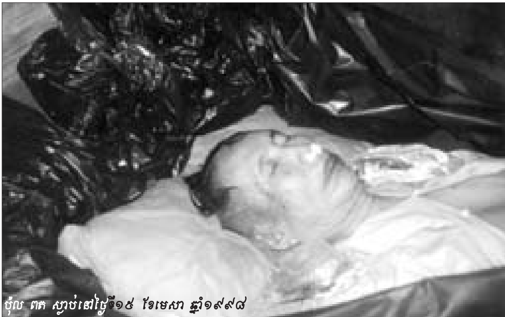
ប៉ុល ពត ស្លាប់នៅថ្ងៃទី១៥ ខែមេសា ឆ្នាំ១៩៧៨

យោងតាមក្រុមអ្នកជំនាញច្បាប់ មានភស្តុតាងសំខាន់ៗគួរ ឲ្យចាប់អារម្មណ៍ដែលបង្ហាញថា នួន ជា មានតួនាទីបង្កើតគោល នយោបាយសម្រាប់សម្រាប់បក្សកុម្មុយនិស្តកម្ពុជា ។ ភស្តុតាង សំខាន់ៗខ្លះទៀតបង្ហាញថា នួន ជា បានដើរតួនាទីយ៉ាងសំខាន់ ក្នុងការអនុវត្តគោលនយោបាយនេះ ។ ឧទាហរណ៍ នួន ជា ត្រូវ បានជឿថាបានធ្វើទារុណកម្មនិងសម្លាប់កម្មាភិបាលខ្មែរក្រហម ដែលជាអ្នកទោសប្រុសស្រីនិងកុមារ១ម៉ឺន៤ពាន់នាក់នៅមន្ទីរ សន្តិសុខ ស-២១ ដែលត្រូវបានស្គាល់ថាជា “កុកទួលស្មែង” នៅ ក្នុងទីក្រុងភ្នំពេញ ។